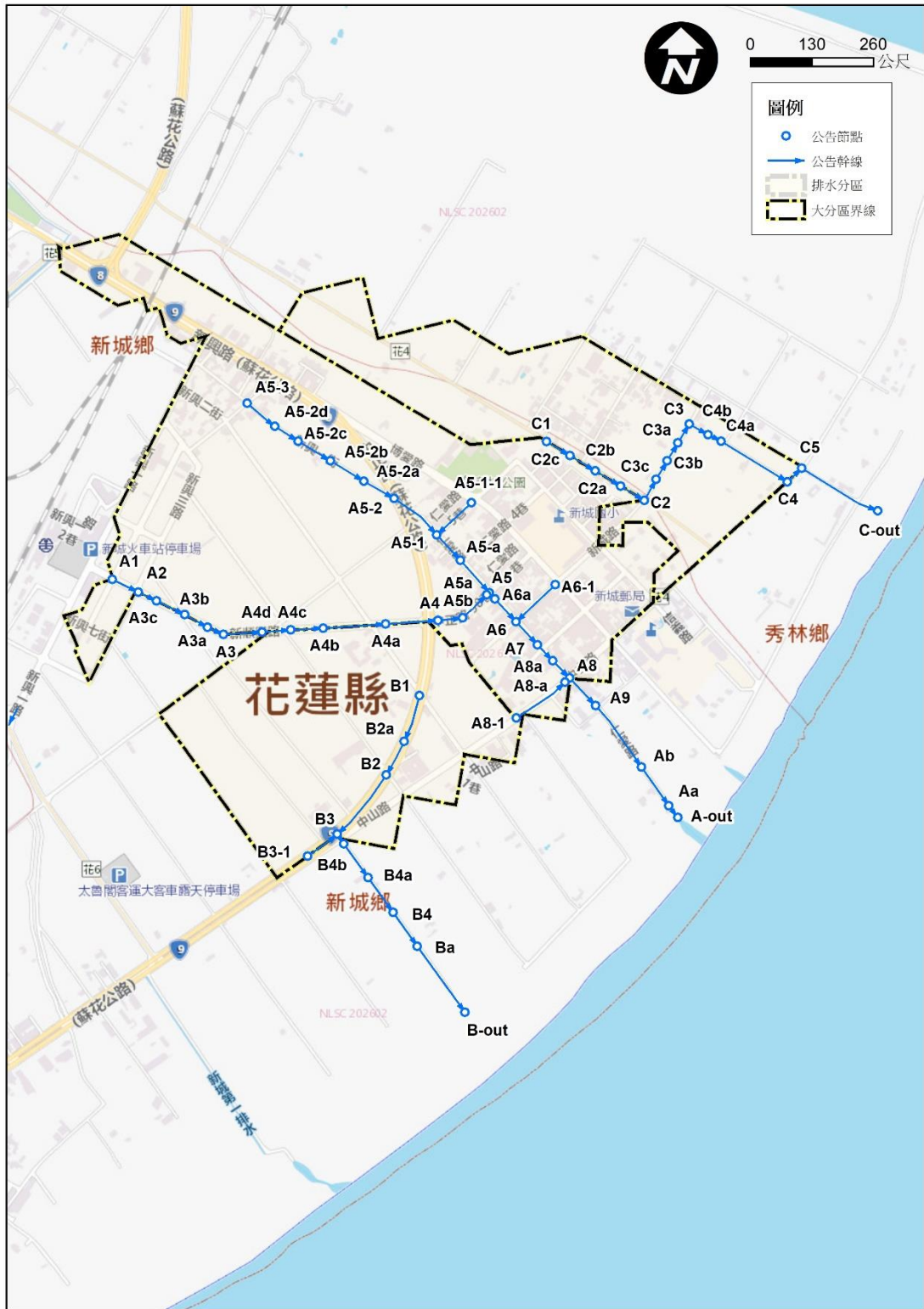
圖 1 花蓮縣新秀(新城-秀林地區)各排水區域範圍圖