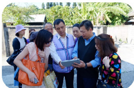
圖二 小組交流與專案演練操作流程圖